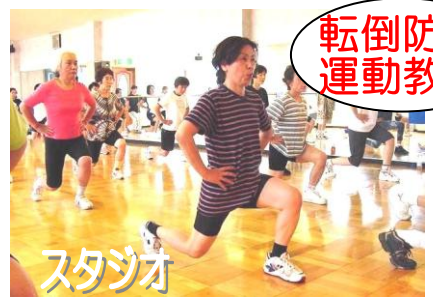
転倒防止 運動教室