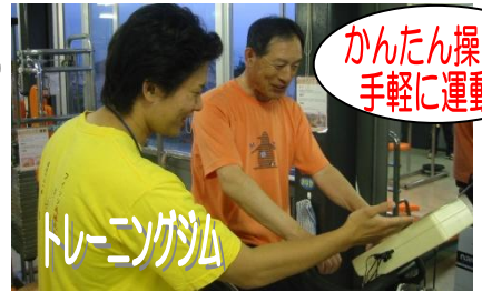
かんたん操作で 手軽に運動♪