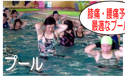
膝痛・腰痛予防に 最適なプール!