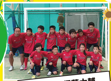
Route 須藤大輔 インドアサッカースクール