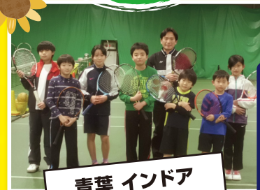
青葉 インドア テニススクール